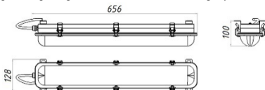
Рисунок 1 Светильник «L-sub 25»

1.5 Общий вид и габаритные размеры светильника показаны на рисунке 1.